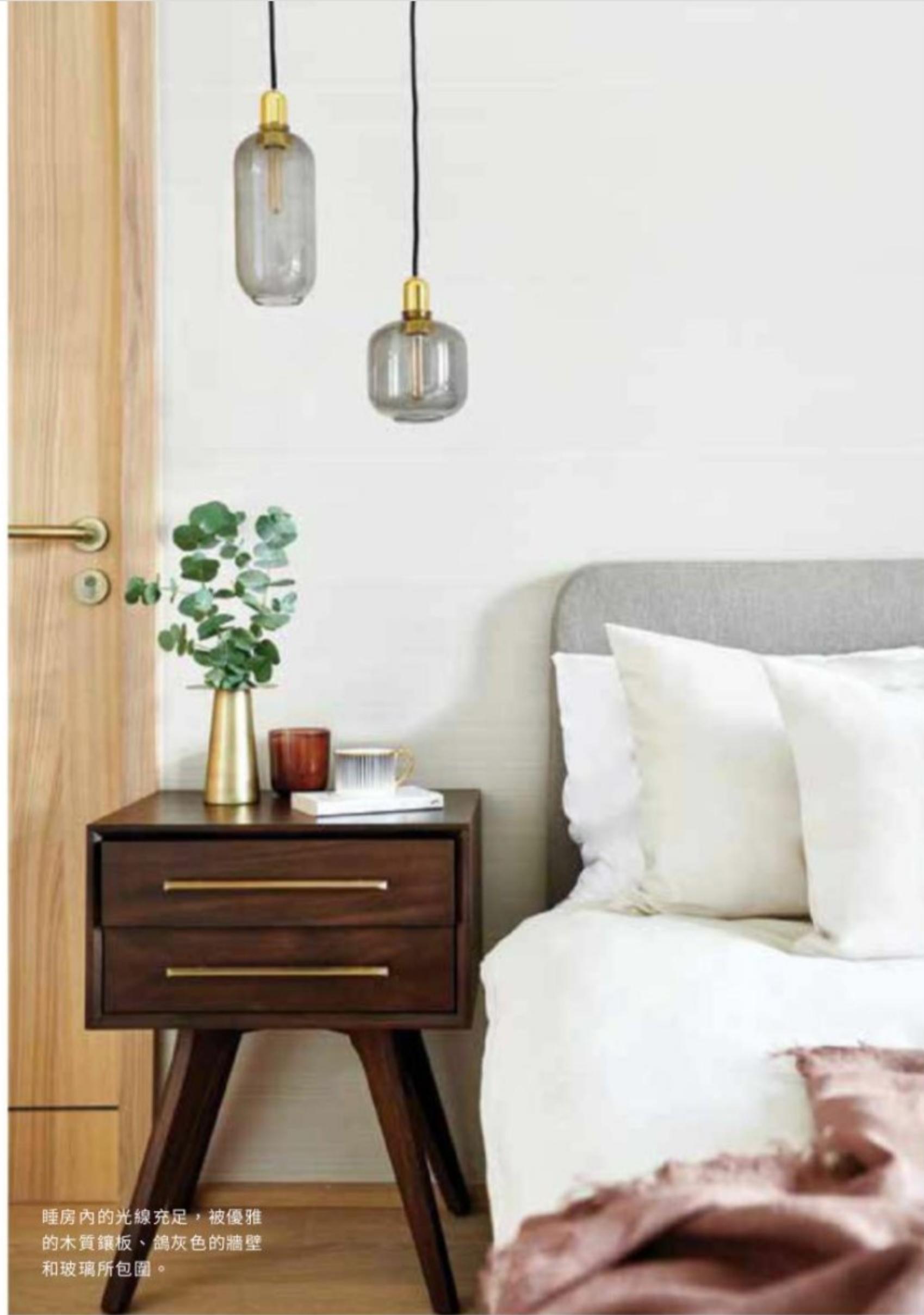
睡房內的光線充足，被優雅的木質鑲板、鵝灰色的牆壁和玻璃所包圍。