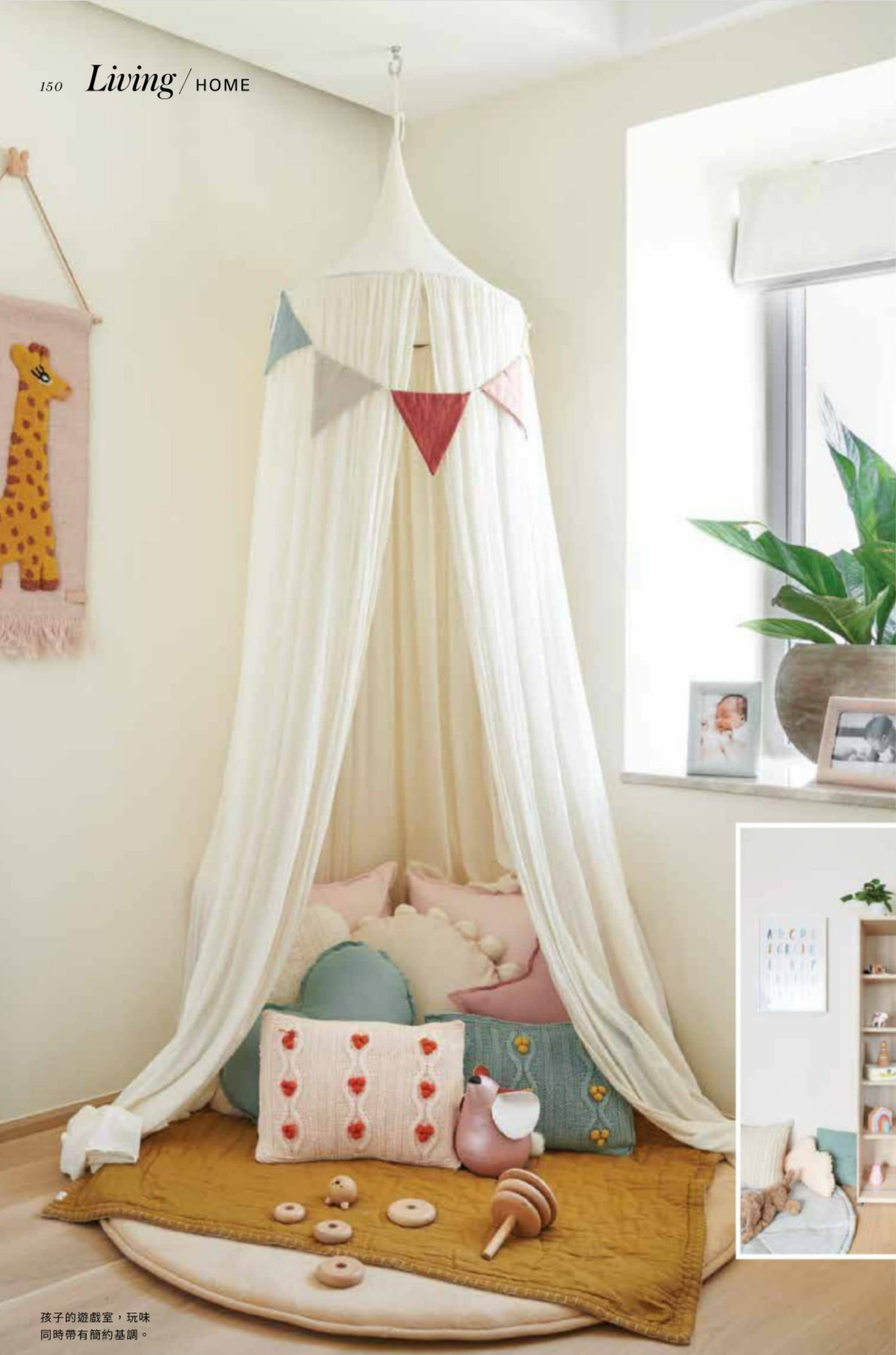
孩子的遊戲室，玩味同時帶有簡約基調。