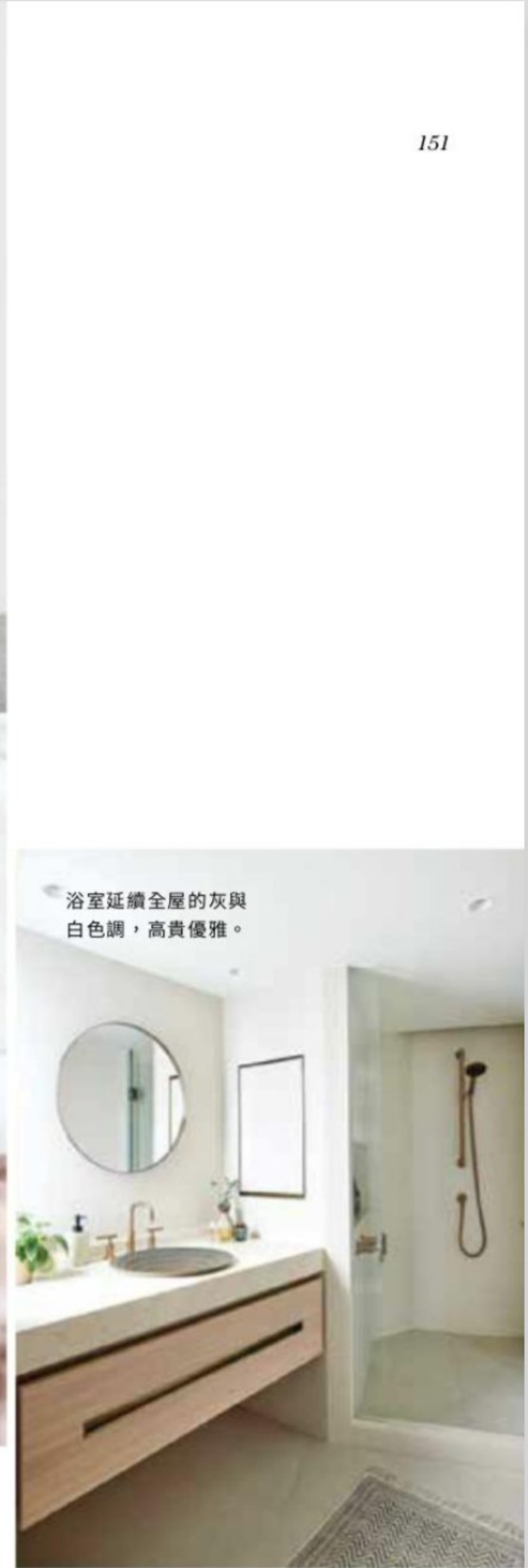
浴室延續全屋的灰與白色調，高貴優雅。

從美學角度看，這是一個柔和的家庭友好型空間，光線充足，被優雅的木質鑲板、鵝灰色的牆壁和玻璃所包圍。趟門將開放式廚房和餐廳與兒童遊戲室分隔開，而一扇隔音玻璃門則通向連接客廳和睡房的走廊。日間孩子們四處玩耍，到成年人與朋友們在晚餐時放鬆下來，白天和晚上的生活空間有明確的區分。